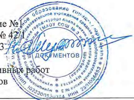
График проведения административных работ для учащихся 5-9 классов

Приложение №1 к приказу № 42 от 3.04.2023