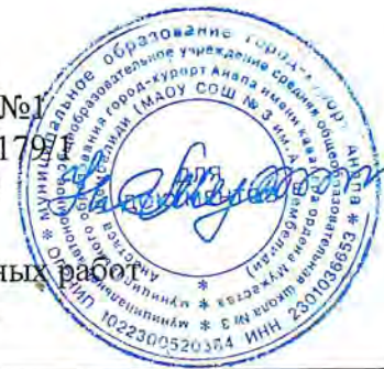
График проведения административных работ для учащихся 5-9 классов

Приложение №1 к приказу № 179/1 от 12.09.2022